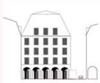
BLICK IN RICHTUNG NEUE FASSADE HOTEL BELLEVUE

Rekonstruktion oder Interpretation der historischen Parzellen und Gebäude nach Relevanz