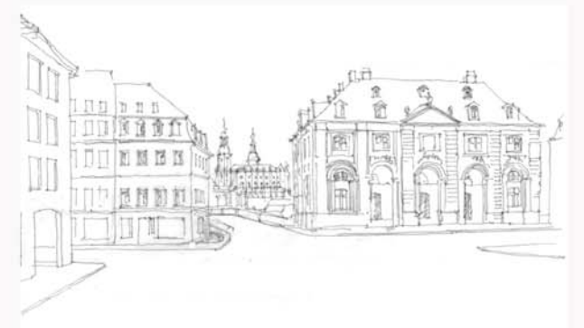
BLICK IN RICHTUNG AUGUSTUSBRÜCKE