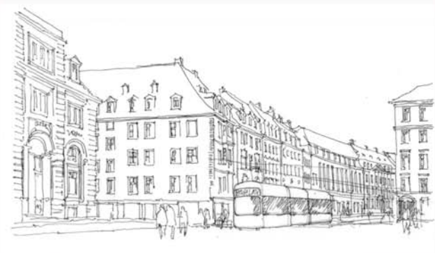
BLICK IN RICHTUNG GROSSE MEISSNER STRASSE

Umbau der Durchgangsstraße zu einer Stadtstraße